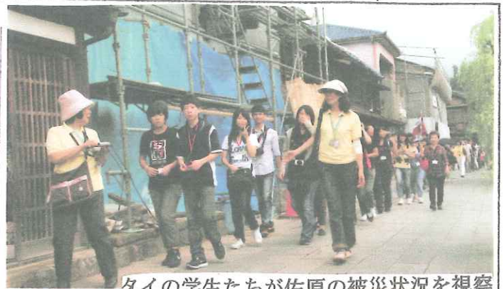
タイの学生たちが佐原の被災状況を視察