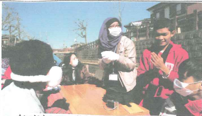
インドネシアの学生にはちょっと寒かったかな？