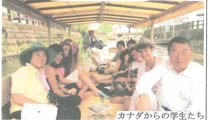
カナダからの学生たち