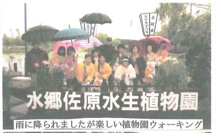
雨に降られましたが楽しい植物園ウォーキング

ホームステイなど国際交流協会の活動に参加していただいている方々などを中心に、英会話の実践をしていただく「英語でウォーキング」を今年も二回、土曜日に、6月9日(水郷佐原水生植物園)、11月27日(観福寺)で開催しました。毎回、家族連れで参加していただき、佐原の魅力を英語で表現するにはどうしたらいいかを学びました。