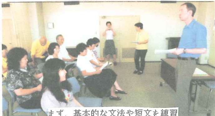
まず、基本的な文法や短文を練習

佐原商工会議所を会場に、一年間にのべ4回の「英会話研修会」(Living English) を実施しました。この研修会は、佐原の商店、食堂、観光案内所などで働いている皆様に、少しでもお役に立てるようにと、数年にわたって実施されています。毎回、英語のネイティブの方にお願ひして、佐原の町案内や商店等での対応の仕方を英語で学んでいます。特に最終回は町の中に出て、実地の研修を行います。