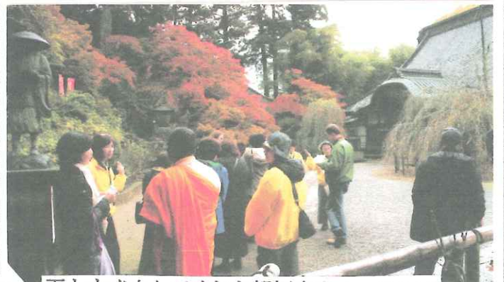
雨もすぐ止んでくれた観福寺ウォーキング