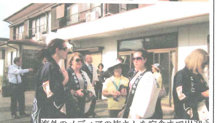
海外のメディアの皆さんを宿舎まで出迎え