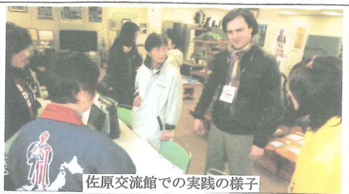
佐原交流館での実践の様子