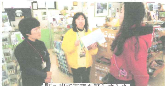
町へ出て英語を話しました